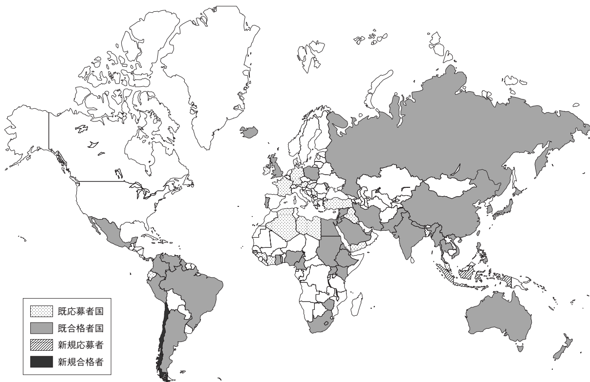
図2 ASCP i 資格への応募者および合格者の概要

受験者は年々増えている。当初はアジアからの応募者が多かったが、現在ではヨーロッパ、南米、アフリカ等からも合格者が出ている。