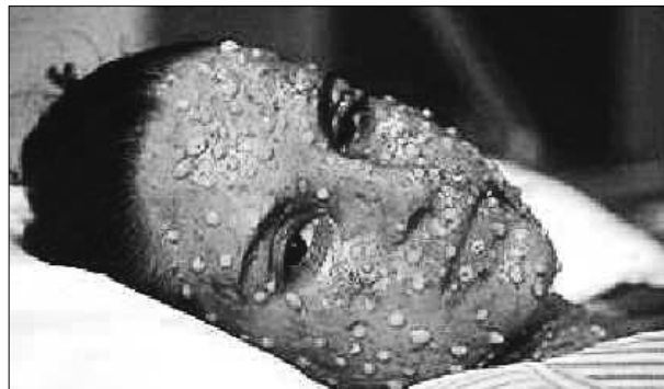
図2 天然痘の症状1 2)

天然痘がわが国に最初の大きな被害をもたらしたのは、735年北九州に入り(つまり、大陸からの人の移動ルート)、次第に東進して737年に平城京で大量の死者をもたらした流行である。この時の流行で、当時の政権の中枢を担っていた藤原氏4兄弟の武智麻呂(たけちまろ)、房前(ふささき)、宇合(うまかい)、麻呂(彼らは、藤原鎌足の孫、すなわち不比等の子)が相次いで死亡し、政治的・社会的に大混乱に陥った。天然痘の恐ろしさの原因は、死亡率の高さが第1であったとしても、痘の出現の皮